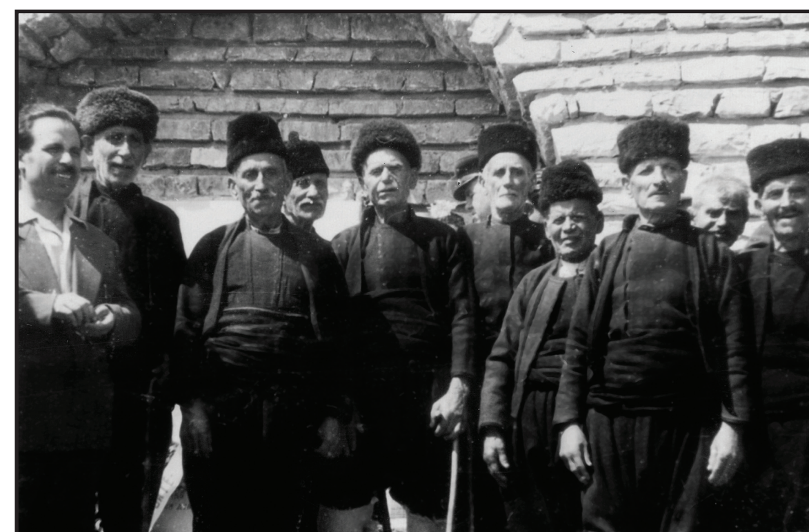
Последните живи преображенци м. Петрова нива 1928 г.

И така, приключва нашата обща песен. Вложихме нашите души и сърца във всичко, което направихме и постигнахме тук, и проклет да е този, който чете това и не влага същото в запазването на българското като нас. Срецигнахме се като непознати, а си тръгваме като едно голямо семейство. Оставихме след себе си единствено добро впечатление у хората и ги научихме на някой и друг лаф, но това вече е друга история. Моля, четящия, научи се от пишещия, бъди добър човек и помни винаги своите корени и своята славна майка България. Човек е това, което оставя след себе си!