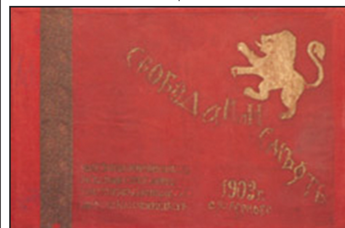
Знамето на Заберската смъртна дружина, НВИМ

бор на Петрова нива - Петър Горов отковал дъската, извадил зна-